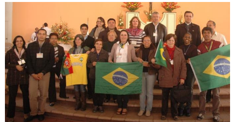
Alguns participantes do Brasil

Embora a grande maioria dos participantes falasse espanhol, a comunicação não foi problema em nenhum momento porque os temas estavam traduzidos em português e durante as palestras e depoimentos houve um serviço de tradução simultânea. A alegria dos brasileiros foi contagiante e deu para constatar como nosso povo é querido e apreciado por todos.